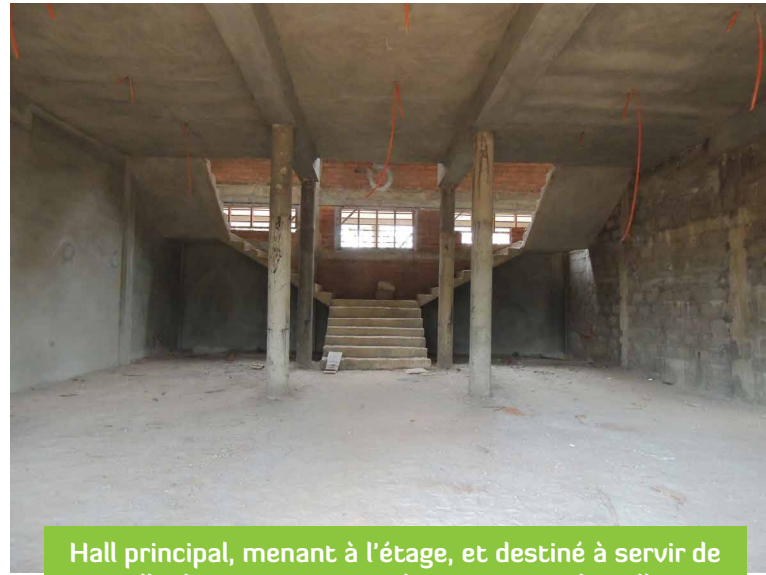
Hall principal, menant à l'étage, et destiné à servir de salle d'exposition pour des oeuvres culturelles