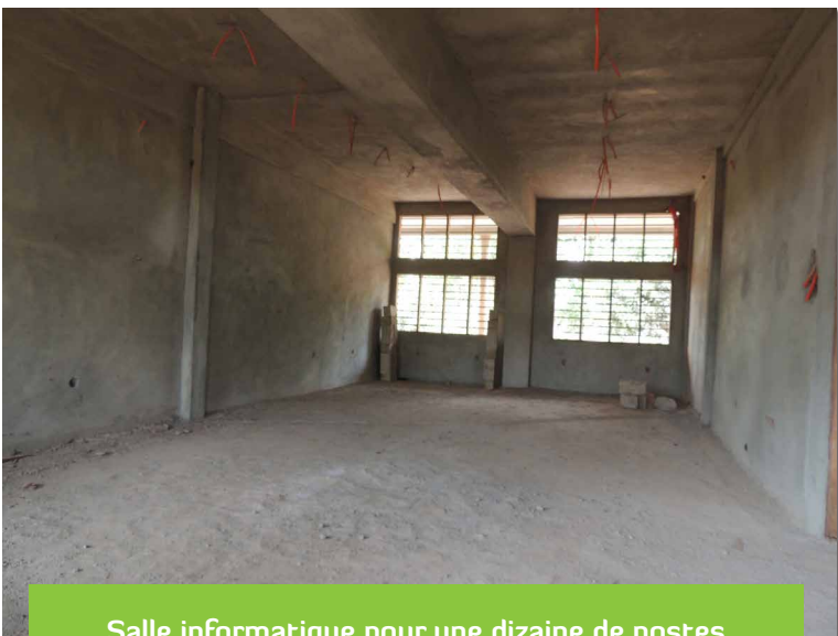
Salle informatique pour une dizaine de postes