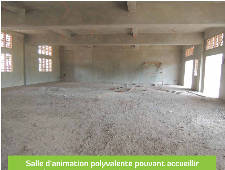
Salle d'animation polyvalente pouvant accueillir jusqu'à 100 personnes et divisible en trois espaces