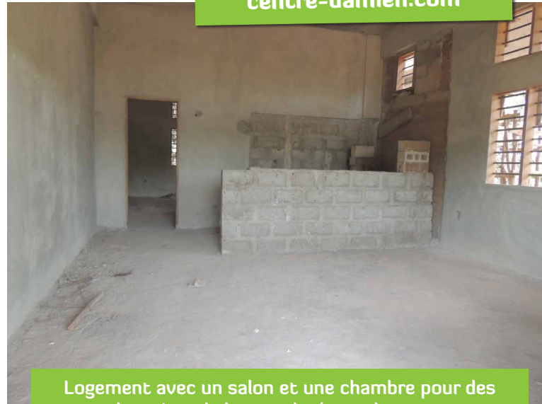
Logement avec un salon et une chambre pour des volontaires de longue durée ou de passage